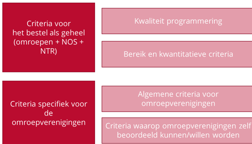
Figuur 2: categorieën van criteria